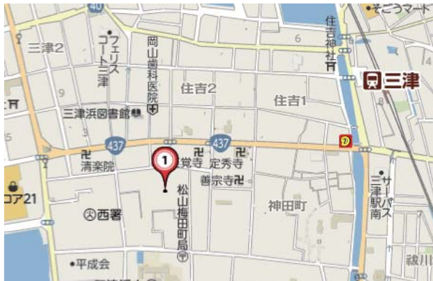
【左図】松山市三津浜支所 場所

(住所：松山市三津三丁目 2-30) バス停「三津2丁目」から徒歩約3分。三津浜港から徒歩約9分。 伊予鉄道三津駅から徒歩約10分。